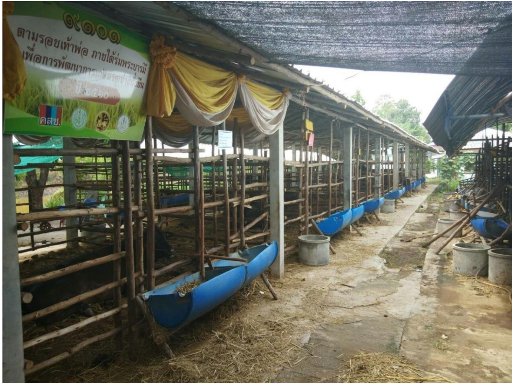
คอกกลาง 1 :อบต.สลักได อ.เมืองสุรินทร์