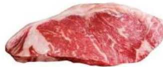
Australian 120 days Grain-fed Striploin 220-240g/pc unit 450 บาท 235.-