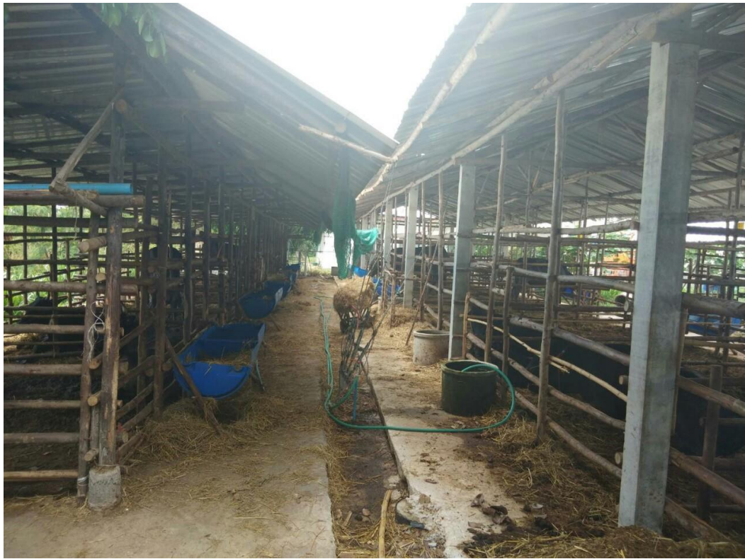
คอกกลาง 2:ม.10 ต.บ้านฝื่อ อ.จอมพระ จ.สุรินทร์