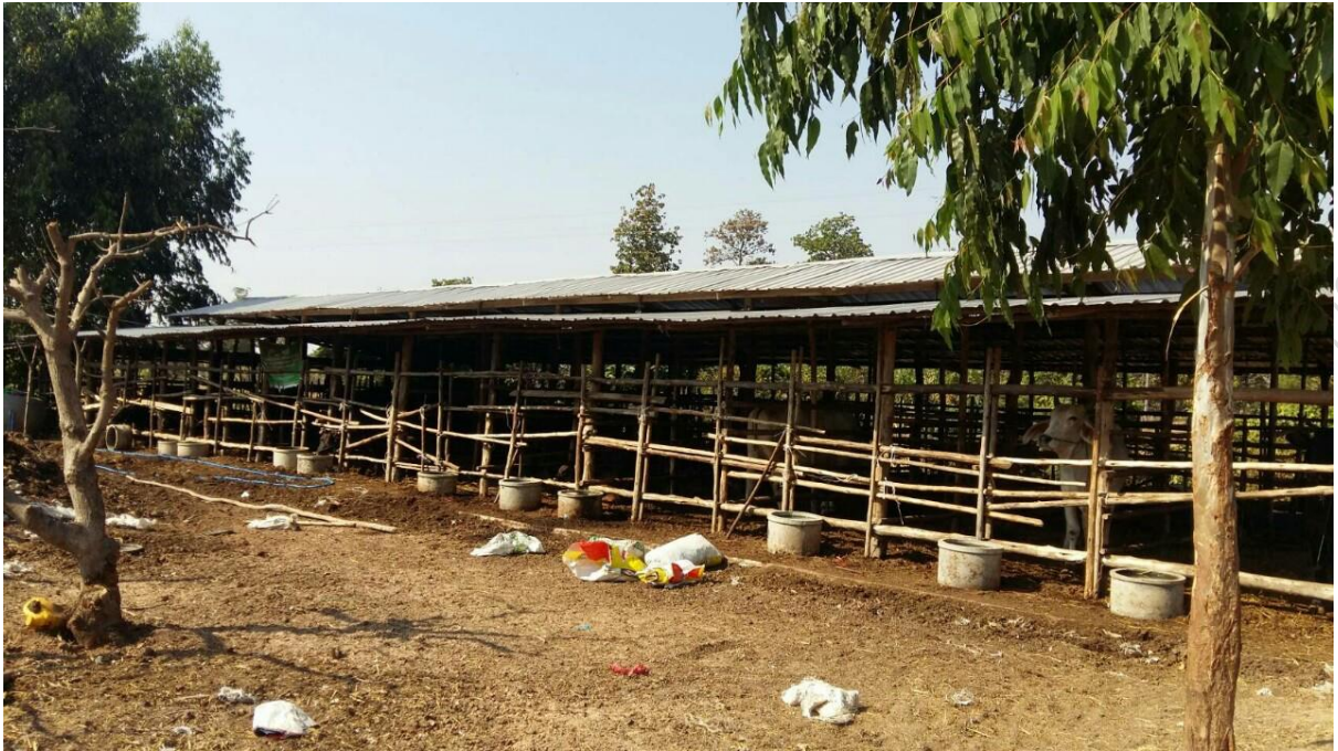
คอกกลาง3: บ้านเสม็ดใหญ่ ม.9 ต.สลักไถ่ อ.เมืองสุรินทร์