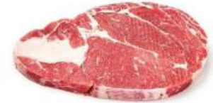
Australian 120 days Grain-fed Ribeye 260-300g/pc unit 600 บาท 390.-

ทั้งนี้ปัญหาที่วิสาหกิจชุมชนโคขุนสุรินทร์โกเบครบวงจรตำบลสลักไถ่ประสบ คือ ปัญหาโคเนื้อลูกผสมสายพันธุ์ไทยวากิวที่จะเข้าสู่กระบวนการเลี้ยงขุน มีปริมาณผลผลิตไม่เพียงพอกับความต้องการของคู่ค้าซึ่งมีความต้องการประมาณเดือนละ 60 ตัว หรือ ปีละ 720 ตัว แต่กลุ่มวิสาหกิจชุมชนฯ ผลิตได้เพียงเดือนละ 18 ตัว หรือปีละ 216 ตัว (ผลิตได้ร้อยละ 30 ของตลาดที่มีอยู่) คณะกรรมการธุรกิจปศุสัตว์และแปรรูป สภาหอการค้าแห่งประเทศไทย ร่วมกับหอการค้าจังหวัดสุรินทร์และสำนักงานปศุสัตว์จังหวัดสุรินทร์ หาแนวทางการบริหารจัดการปัญหาดังกล่าว ภายใต้แนวคิดในการขยายคอกกลางขุนโค (Central feedlot) ไปยังฟาร์มที่มีศักยภาพ เพื่อยกระดับเป็นคอกกลางในพื้นที่จังหวัดสุรินทร์ จำนวน 5 ฟาร์มซึ่งจะมีกำลังการผลิตเพิ่มขึ้นรวม 240 ตัว/ปี(ผลิตเพิ่มอีกร้อยละ 33รวมเป็นร้อยละ 63 ของตลาดที่มีอยู่)ภายใต้การควบคุม กำกับดูแล ระบบการบริหารจัดการฟาร์มตามมาตรฐานการผลิตที่กำหนดไว้ด้วยการปรับปรุงระบบมาตรฐานการป้องกันโรค และการเลี้ยงสัตว์ที่เหมาะสมภายใต้ระบบฟาร์มมาตรฐานอย่างน้อย GFM (Good Farming Management) พัฒนาแอปพลิเคชันซื้อขายสินค้าออนไลน์ เพื่อยกระดับเกษตรกรโคขุนของสุรินทร์เป็นปศุสัตว์ 4.0 รวมทั้งเป็นโครงการนำร่องเพื่อขยายผลในกลุ่มอื่นๆ ต่อไป