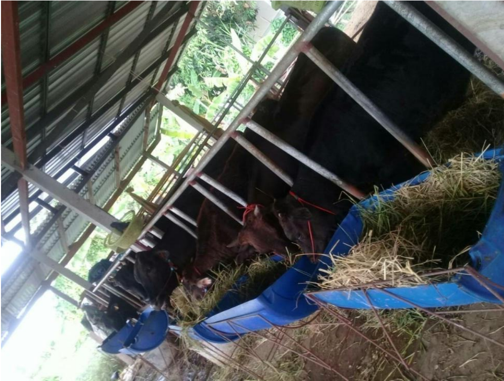
คอกกลาง 5: บ้านตะบับ ม.7 ต.สลักได อ.เมืองสุรินทร์