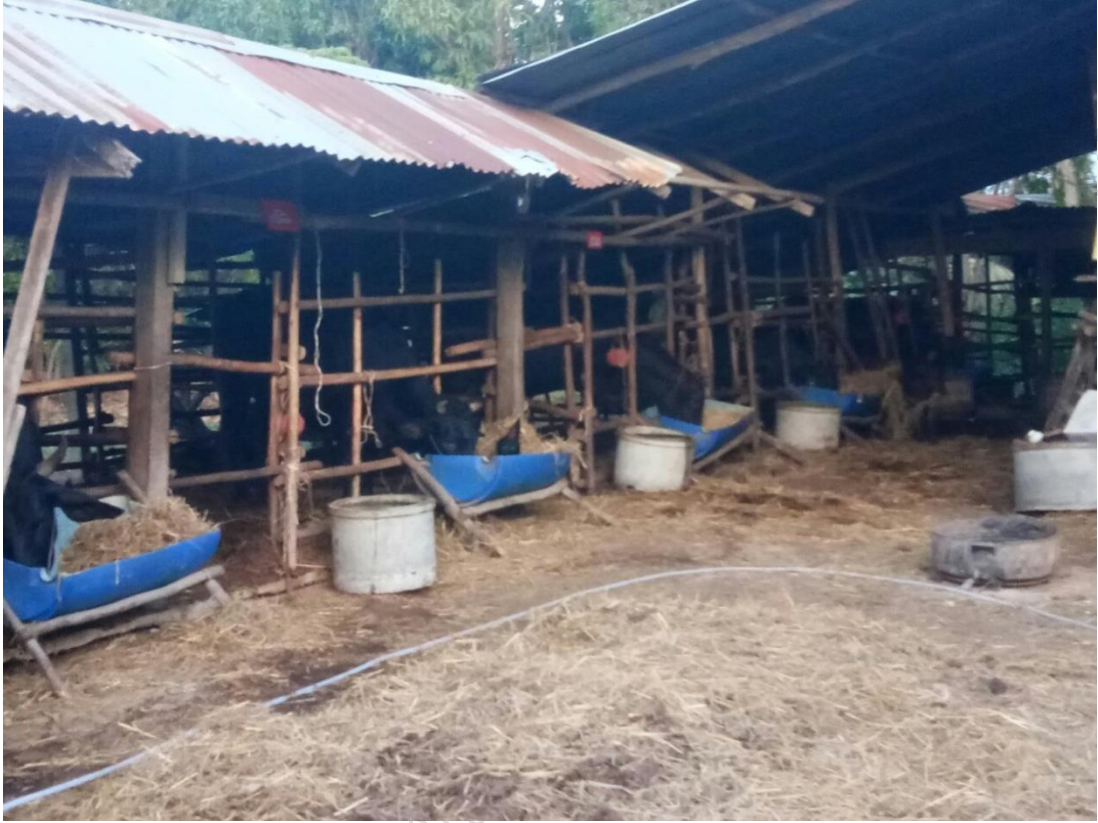
คอกกลาง4: 50 ม.9 ต.เพ็ชราม อ.เมืองสุรินทร์