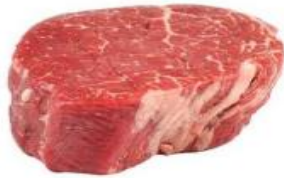
Lewis Farm Olive Fed Wagyu mb 4-5 Tenderloin 160-200g/pc unit 1,250 บาท 720.-